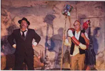
Die Produktionen sind sehr unterschiedlich, aber alle haben ein gemeinsames Ziel: die Zuschauer zu unterhalten und zu begeistern.

DIE FRÄNKISCHE THEATERSZENE LÄSST SICH VON DEN PANDEMISCH BEGRÜNDETEN BESCHRÄNKUNGEN NICHT VERUNTERSCHEN, DANK DER SALE MIT AUFLAGEN WIEDER FÜLLEN UND SCHAUT OPTIMISTISCH AUF DAS NEUE JAHR VORWAUS